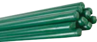
Barres de tension plastifiées ou galvanisées