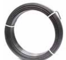
Fils d'attache plastifiés ou galvanisés