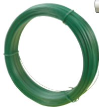
Fils de tension plastifiés ou galvanisés