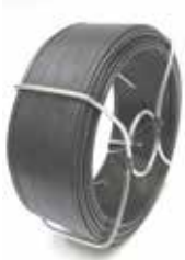
Bobinots plastifiés ou galvanisés